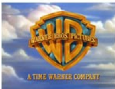
10th Logo "The Shield Returns" (1984-1998)