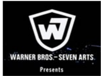
6th Logo "WB-7" (1967 - 1970)