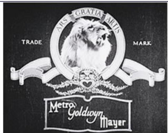
Slats, in the first official MGM logo, 1924 - 1928