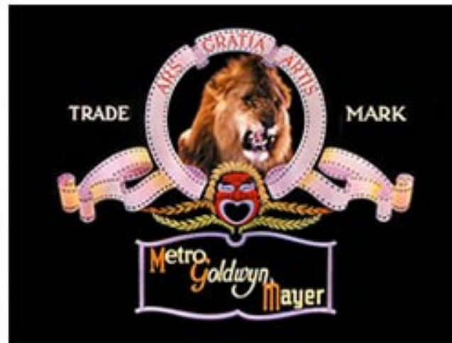
Tanner, the third lion, 1934 - 1956