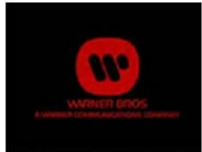
9th Logo "The Big W" (1972 - 1984)