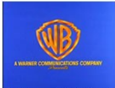
8th Logo "WCI Shield" (1972)