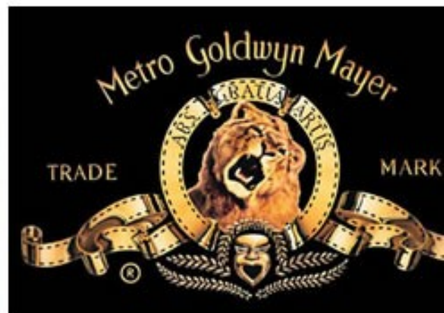
Leo the Lion, 1957 - present