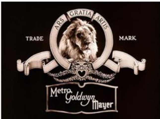
Jackie, the second lion, 1928 - 1956