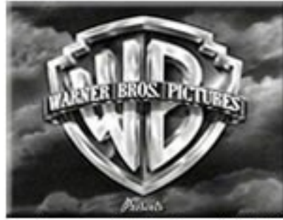
5th Logo "Classic Shield" (1948 - 1967)