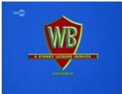
7th Logo "The Kinney Shield" (1970 - 1972)