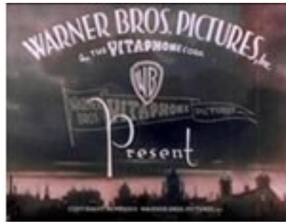
2nd Logo "Vitaphone Shield" (1929 - 1936)