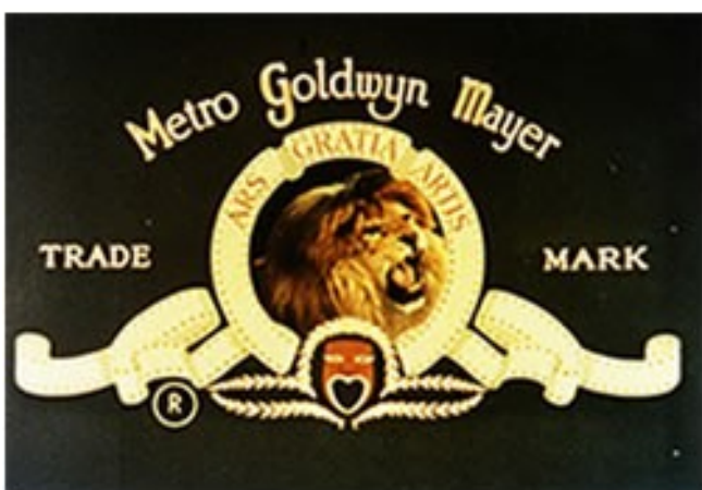
An unnamed fourth lion, 1956 - 1958