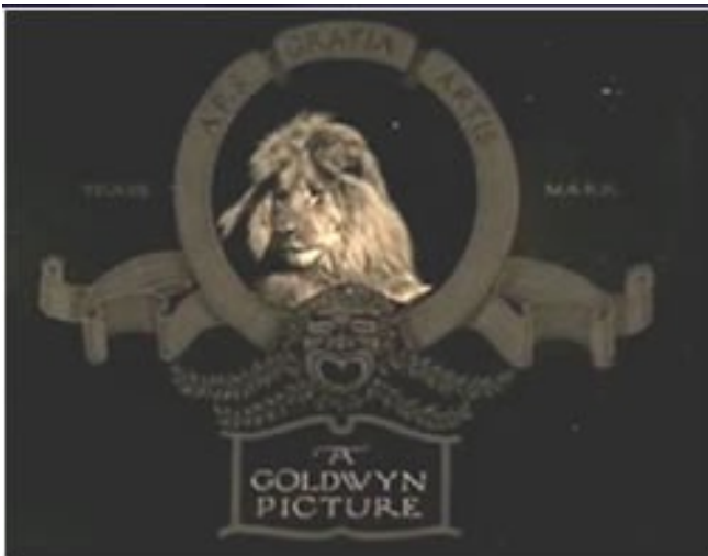
Slats, the Original "Leo The Lion" at Golwyn Pictures, 1916 - 1924