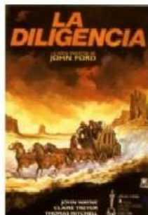
La diligencia (1939)

1930 - Billy the Kid (BILLY THE KID), de King Vidor