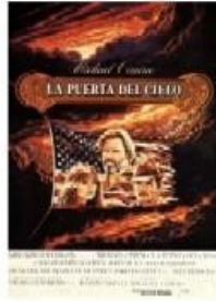
La puerta del cielo (1980)

1980 – Heaven's Gate (LA PUERTA DEL CIELO) , de Michael Cimino