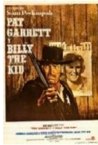
Pat Garrett y Billy the Kid (1973)

1970 – Barquero (LOS FORAJIDOS DE RIO BRAVO) , de Gordon Douglas