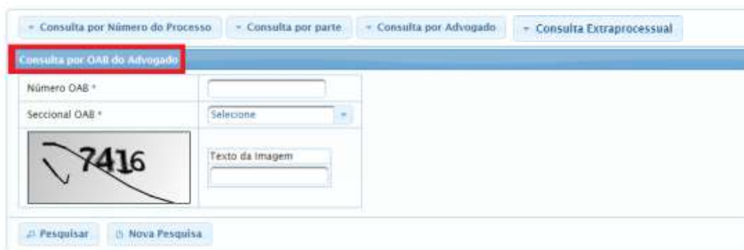
Figura 11 - Consulta por OAB Advogado