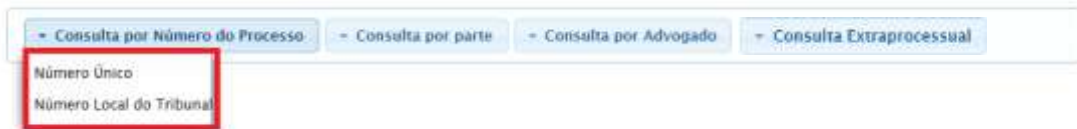
Figura 2 - Consulta Por Número do Processo