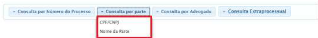
Figura 6 - Consulta Por Partes