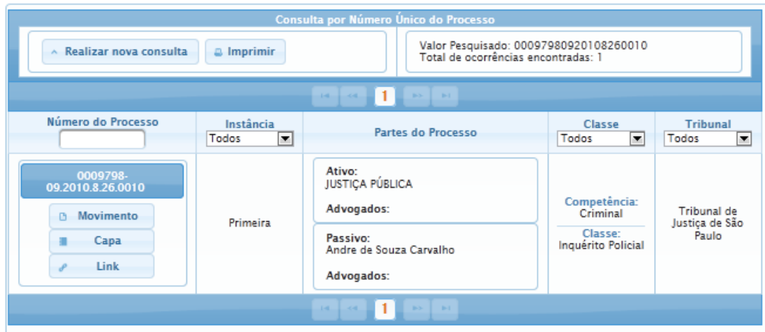
Figura 5 - Consulta Por Número Único do Processo