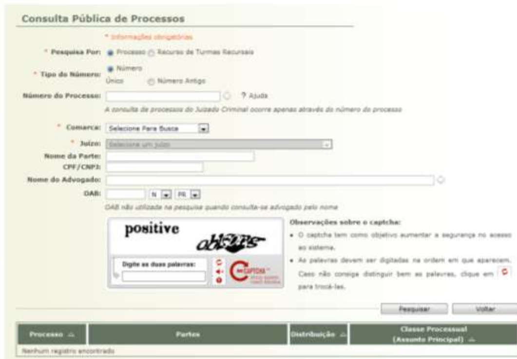
Figura 19 - Tela que chama o site do tribunal que o processo está sendo julgado