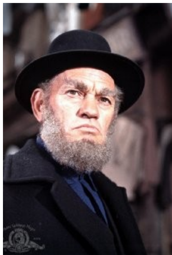
Harry Andrews (1911-1989) - Father de Bearn