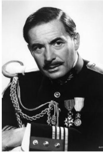
Leo Genn (1905-1978) - Gen. Jung-Lu