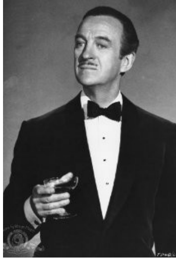
David Niven (1910-1983) - Sir Arthur Robertson