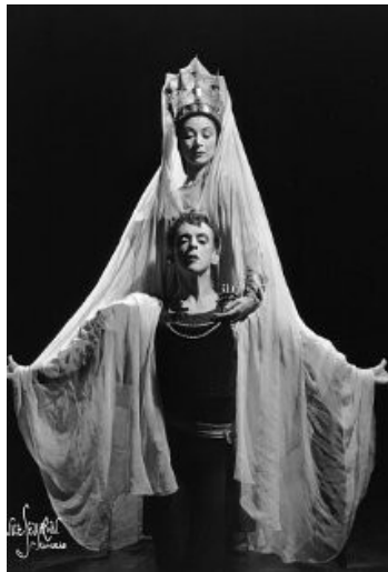
Robert Helpmann (1909-1986) - Prince Tuan