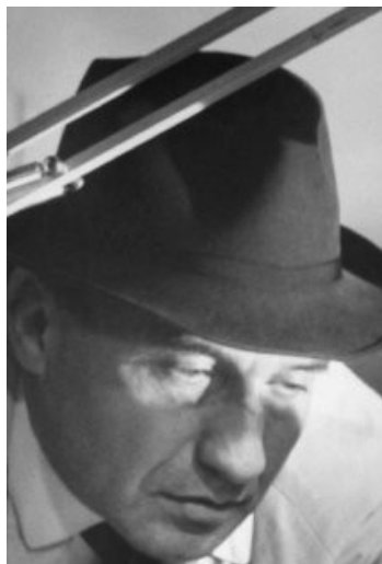
Walter Gotell (1924-1997) - Capt. Hoffman

Joseph Fürst (1916-2005) - Capt. Hanselman