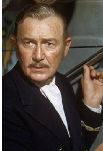
Paul Lukas (1891-1971) - Dr. Steinfeldt