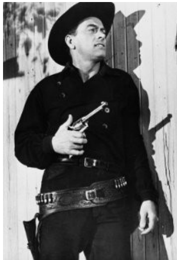
John Ireland (1914-1992) - Sgt. Harry