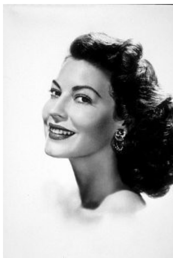
Ava Gardner (1922-1990) - Baroness Natalie Ivanoff