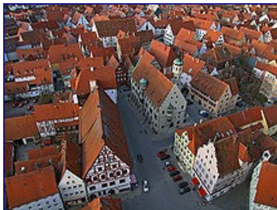
Nördlingen , o local das cenas finais do filme.

As filmagens tiveram início em 30 de abril e foram finalizadas em 19 de novembro de 1970.