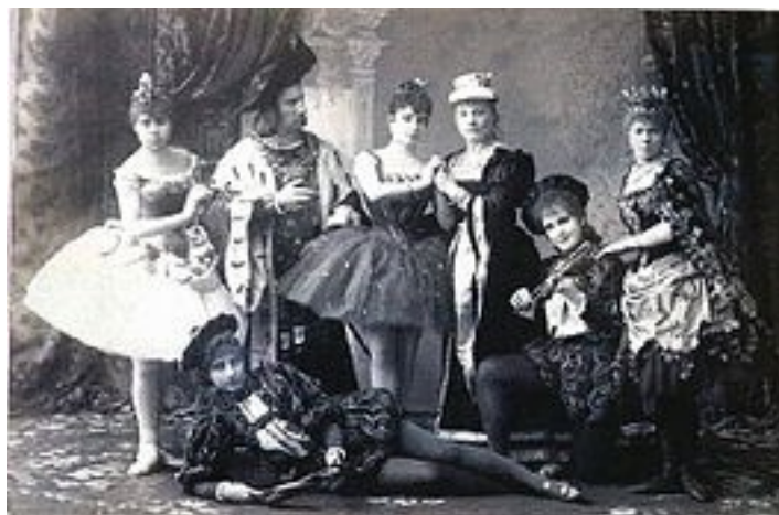
Elenco da montagem original (Teatro Mariinsky, São Petersburgo, 1890)