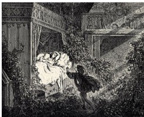
A Bela Adormecida , ilustrada por Gustave Doré