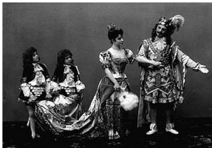
Carlotta Brianza como Princesa Aurora e Pavel Gerdt como Príncipe Désiré, em cena do Ato III da montagem original (Teatro Mariinsky, São Petersburgo, 1890)