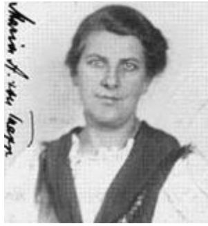
A verdadeira Maria von Trapp