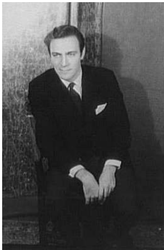
Christopher Plummer, ator de A noviça rebelde , em foto de 1956.