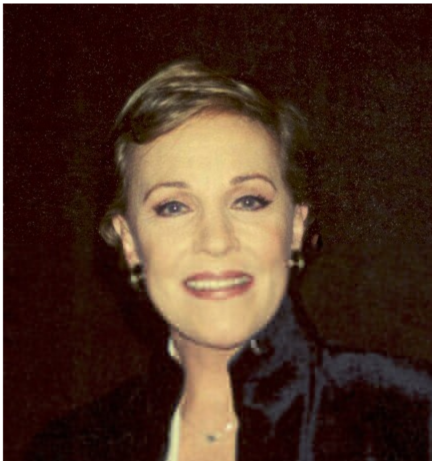
Julie Andrews, atriz de A noviça rebelde , em foto de 2003.