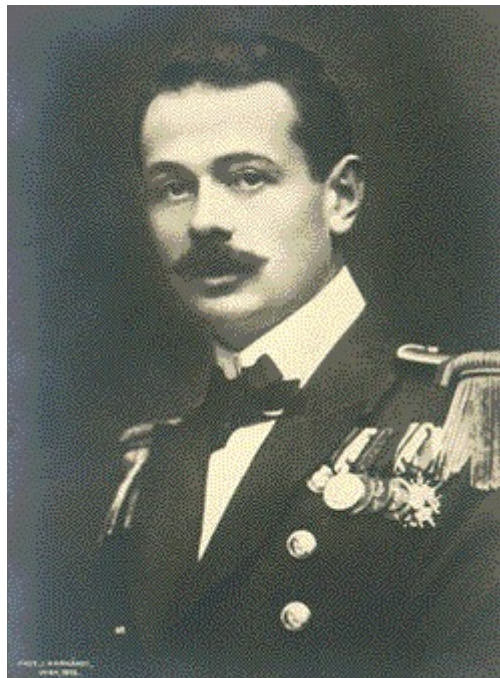
O verdadeiro Georg von Trapp