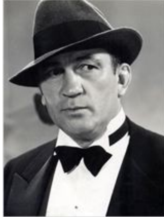
Victor McLaglen - Sgt. Festus Mulcahy