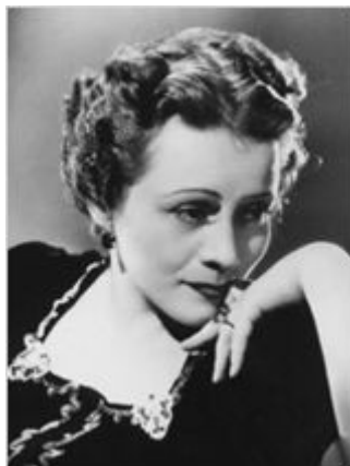
Irene Rich - Sra. Mary O'Rourke