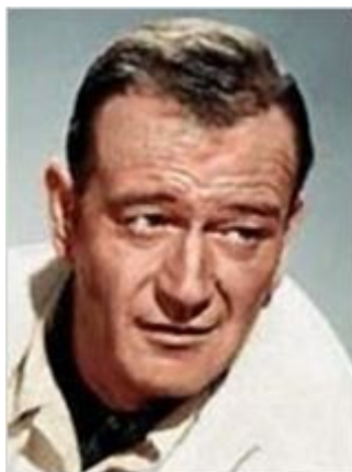
John Wayne - Capt. Kirby York

- Pai dos atores Peter Fonda e Jane Fonda e avô da atriz Bridget Fonda.- Tinha o aeromodelismo como hobby.- É o ator mais velho a ganhar um Oscar, tendo 76 anos ao receber o prêmio por "Num Lago Dourado".- Possui uma estrela na Calçada da Fama, localizada em 1601 Vine Street.