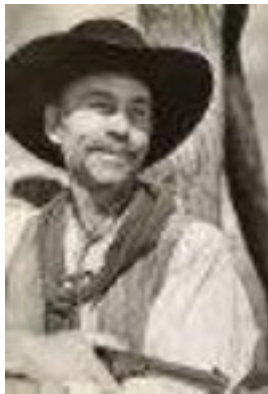
Hank Worden (1901-1992) - Southern Recruit