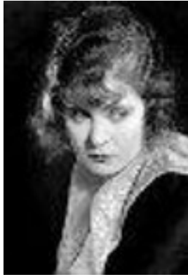
Mae Marsh - Sra. Gates