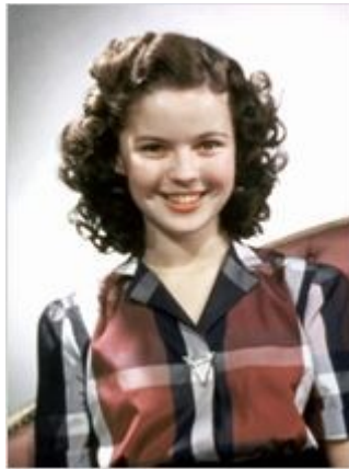
Shirley Temple - Philadelphia 'Phil' Thursday

Possui o recorde 142 filmes como um dos personagens principais; - Considerado o 16º ator mais importante da história do cinema, de acordo com a revista Empire; - Jogou futebol americano pela Glendale High School e USC; - Possui uma estrela na Calçada da Fama, localizada em 1541 Vine Street;- Chegou a receber convite para estrelar Os Doze Condenados (1967), mas o compromisso assumido com Os Boínas Verdes (1968) o deixou de fora e o papel acabou ficando com Lee Marvin.