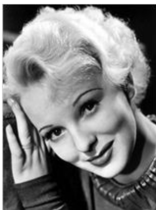
Anna Lee - Sra. Emily Collingwood