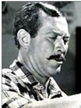
Ward Bond - Sgt. Major Michael O'Rourke