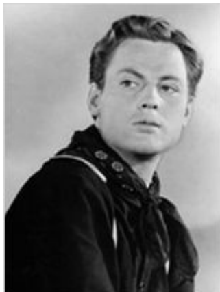
John Agar - 2º Ten. Michael Shannon O'Rourke