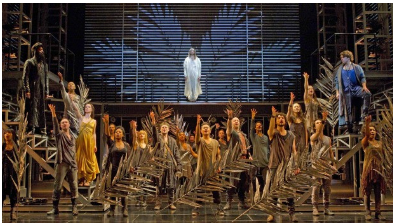
jesus christ superstar