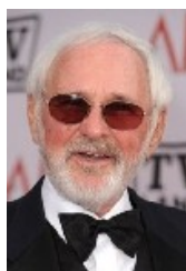
Norman Jewison (1926)- Diretor