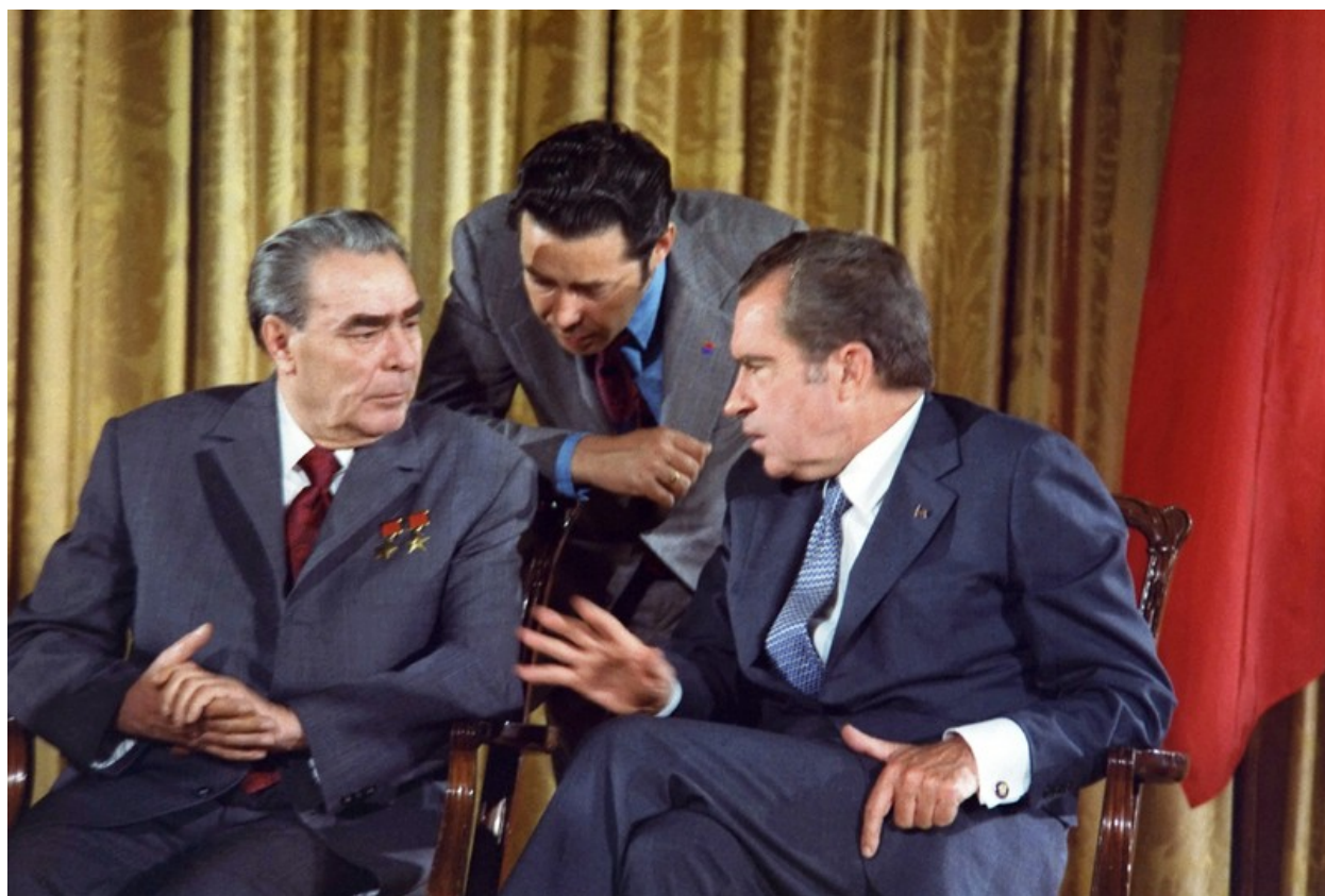
Richard Nixon and Leonid Brezhnev meeting during the Soviet Premier's 1973 visit to the U.S. *Date: June 19, 1973