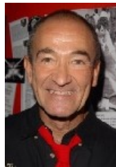
Barry Dennen (1938) - Pontius Pilate