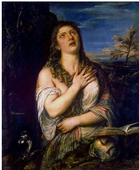
Titian (Tiziano Vecellio) - Repentant Mary Magdalene, oil on canvas, 119x97 cm Location - St. Petersburg – Italien, Gallery.'

Pedro responde que teve de o fazer para salvar a si mesmo, já que provavelmente seria preso e processado se fosse descoberto que era amigo próximo de Jesus.