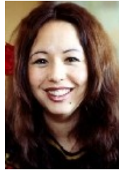
Yvonne Elliman (1951 - Mary Magdalene