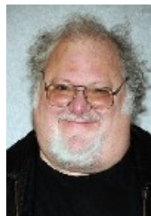
Josh Mostel (1946) - King Herod