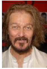
Ted Neeley (1943) - Jesus Christ