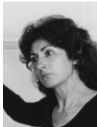
Joanna Merlin (1931) - Nurse Pierce