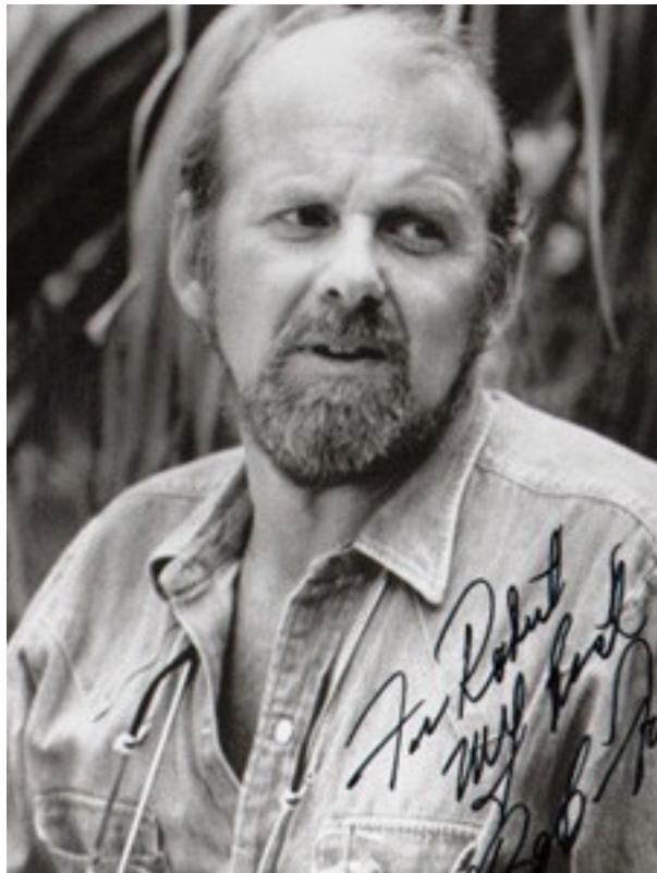
Direção: Bob Fosse (1927 - 1987)

Em 'All That Jazz', o dançarino, escritor, diretor e coreógrafo estadunidense Robert Louis Fosse, nascido em Chicago numa família norueguesa, tem a coragem de se mostrar um viciado, mulherengo, perfeccionista e um manipulador.