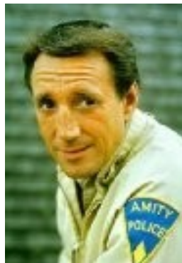
Roy Scheider (1932 – 2008) - Joe Gideon