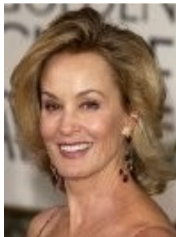
Jessica Lange (1940) - Angelique