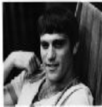
Cliff Gorman (1936 – 2002) - Davis Newman