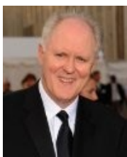
John Lithgow (1945) - Lucas Sergeant