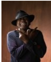
Ben Vereen (1946) - O'Connor Flood