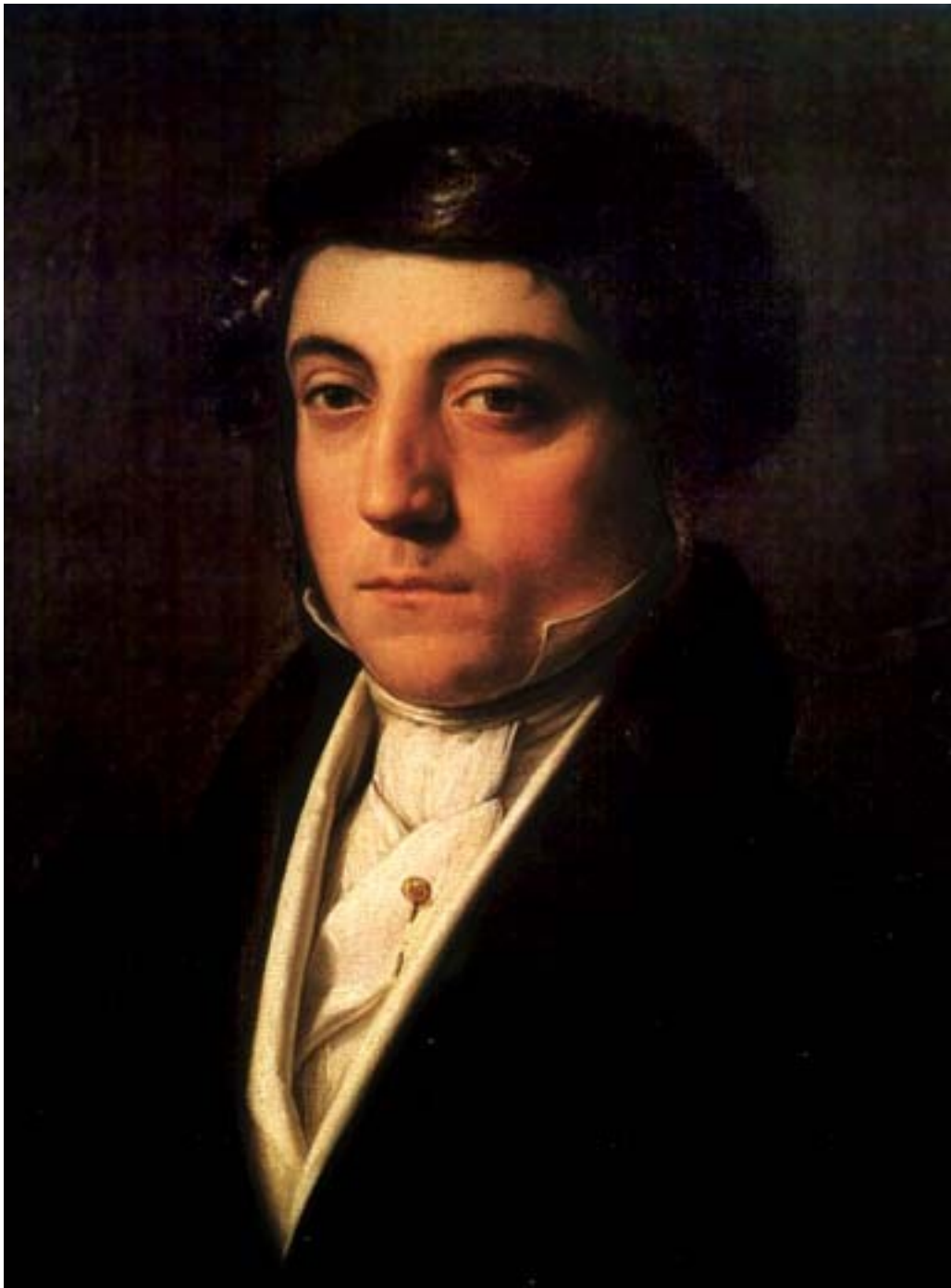
Gioachino Rossini, circa 1817 por Vincenzo Camuccini – Ópera Glass Óleo sobre tela - Museo del Teatro alla Scala in Milan