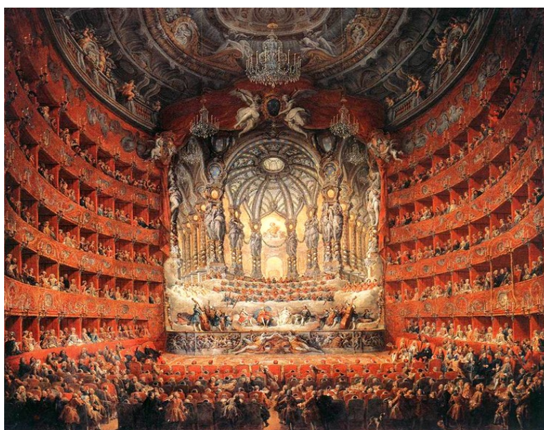
Pannini, Giovanni Paolo - Musical Fête - 1747 Festa dada pelo cardeal de La Rochefoucauld no Teatro Argentina, em Roma, no ano de 1747, por ocasião do casamento do delfim, filho de Luís XV Óleo sobre tela medindo 207 x 247 cm – Museu do Louvre, Paris – Inv. 414

Um sargento – baixo - Victorio Matarazzo