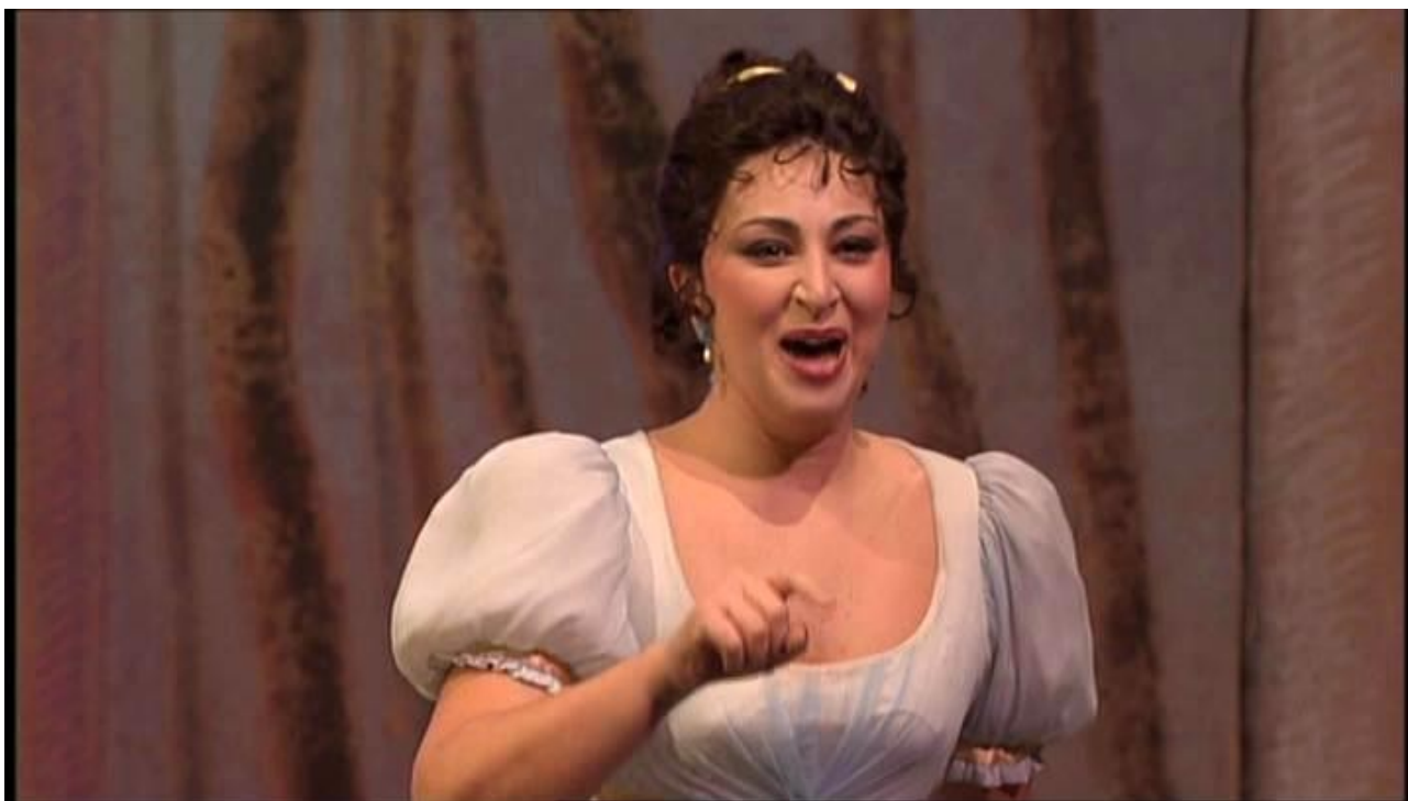
Eva Mei - 1967 - Coloratura soprano - Thaïs