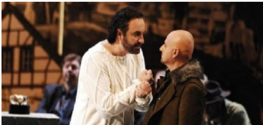
Mechele Pertusi - 1965 – Basso-Baritono - Athanaël