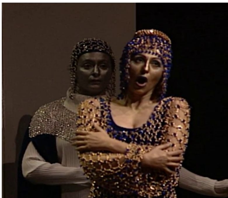
Tiziana Carraro - - Mezzosoprano - Albine