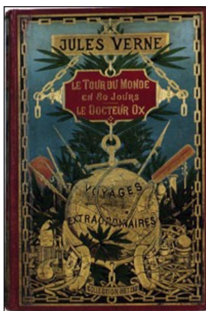
Foto da capa azul do livro A Volta ao Mundo em 80 Dias, editora Hetzel, edição de 1895.

Este filme foi baseado na famosa obra de Júlio Verne, "A Volta ao Mundo em 80 Dias" é um excelente filme de aventuras que conta com um fantástico elenco onde, entre muitos, encontram-se David Niven, Buster Keaton, Marlene Dietrich, Frank Sinatra, Charles Boyer e Trevor Howard.