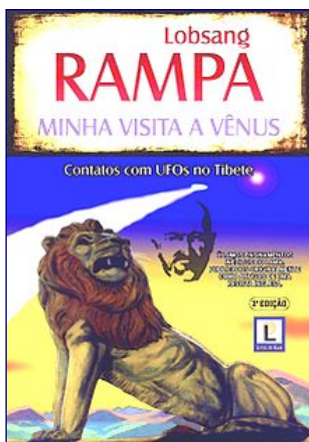
Capa de Minha Visita a Vênus em português © 2009

- Mas o público brasileiro e português fã deste autor e, por quê não, os que o estão conhecendo agora, apreciam este incrível relato do extraordinário Lama tibetano, inédito em nossa língua até 2009, ano em que foi lançado em português. Esta edição esboça um leão, símbolo do Tibete, na capa.