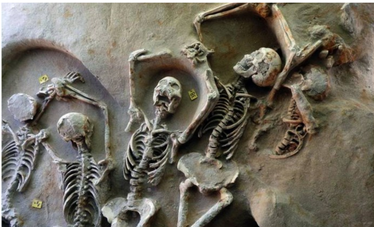
Acorrentados são todos homens

A maioria, porém, foi morta por apedrejamento.