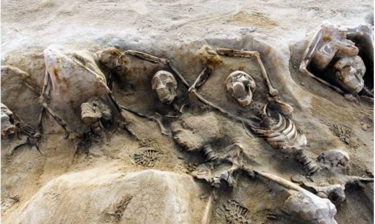
Corpos foram enterrados ainda acorrentados

Restos seriam de seguidores de nobre que queria tomar poder no século VII a.C.