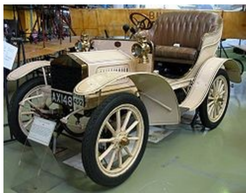
Primeiro Rolls-Royce construído, um modelo 1905, exposto no Museu de Ciência e Indústria em Manchester. Hoje a marca, motorização e fabrica é uma da propriedade da BMW (Alemanha).

Pelo andar da carruagem, a Apple não tem como escapar da decadência que atingiu a NASA e as industrias que antes eram sediadas nos EUA (no Reino Unido também), mesmo apesar de afirmarem que há projetos prontos para mais 4 anos. (e depois, nada???)